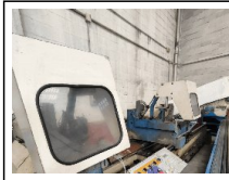
#6: Tronzadora Mecal