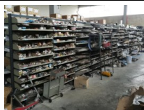
#52: Almacén de Repuestos para Vehículos