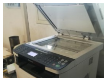
#51: Equipos de Oficina