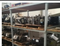
#53: Almacén de Motores para Vehículos